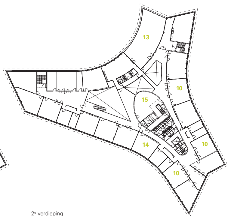
2 e verdieping