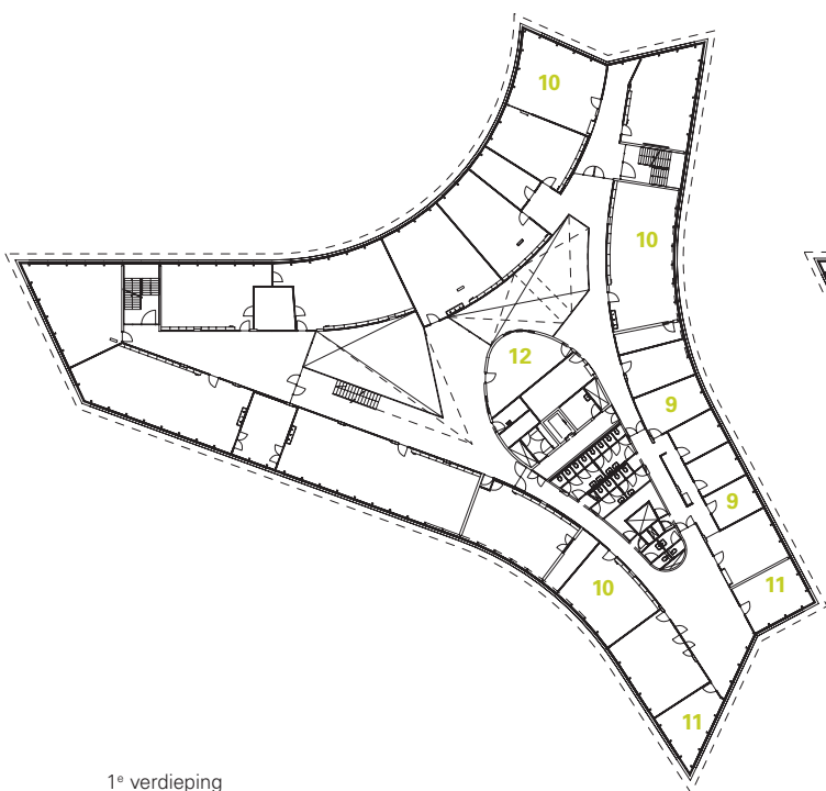
1 e verdieping