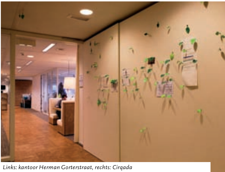
Links: kantoor Herman Gorterstraat, rechts: Cirqada