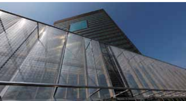
Het kantoor van Rijkswaterstaat in Utrecht: eerst hopeloos verouderd, nu state of the art

werplekken in plaats van een eigen vast bureau en een eigen kamer voor elke werknemer. Bij flexwerken is een norm van 70% gebruikelijk: als voor 7 van de 10 werknemers een werkplek wordt gemaakt, kan in de praktijk altijd