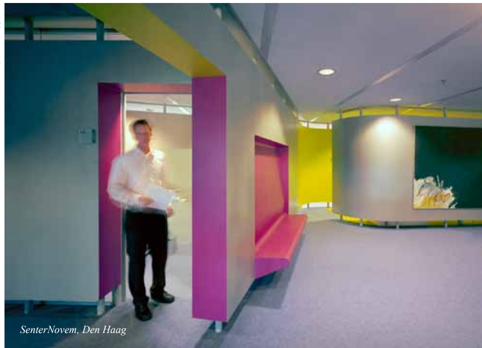
SenterNovem, Den Haag