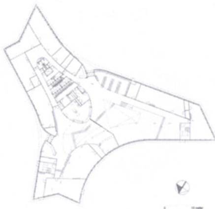
Pianta piano terra

As a result of the task a sculptural design on a green island is born. In this sculpture we have made a bass relief which you can see in the exterior. The floorplan increases at every level and become bigger. In the exterior you