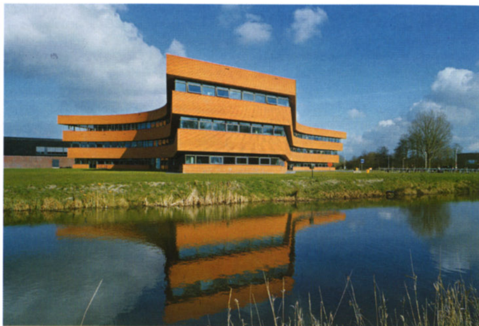
Vista esterna della scuola.

face a stepped façade, a way to express elegance and lightness. We prefer to think that the building floats in the atmosphere. To connect both schools a main hall is placed in the centre of the building and will perform as a meeting point for contact and greeting and will lead the students to their destination. The big open space at the first floor will see for daylight, orientation and open sights in the main hall. In the corridors with the classrooms there is no need for looking in but only transparency and daylight. For this, we