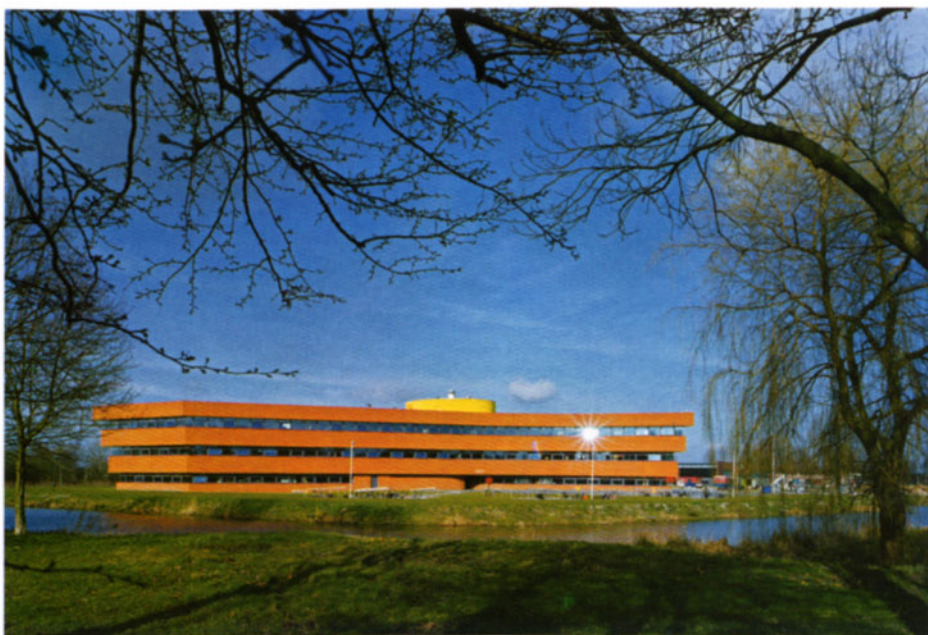
Vista esterna della scuola.

utilizzato finestre che posizionate ad una certa altezza, non disturbano le lezioni, poiché la luce del giorno proviene e permea lo spazio al centro dell'edificio.