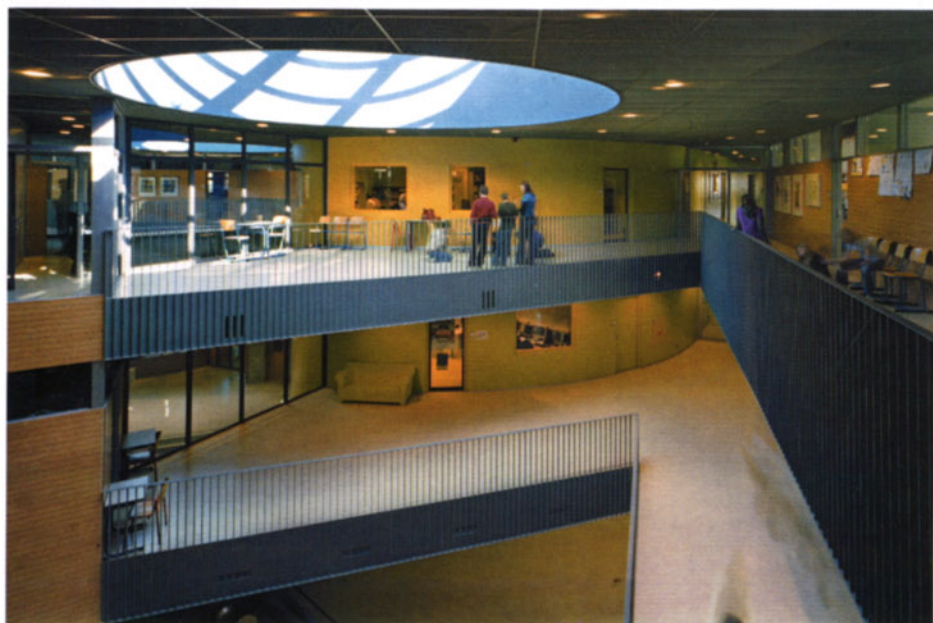
Vista interna