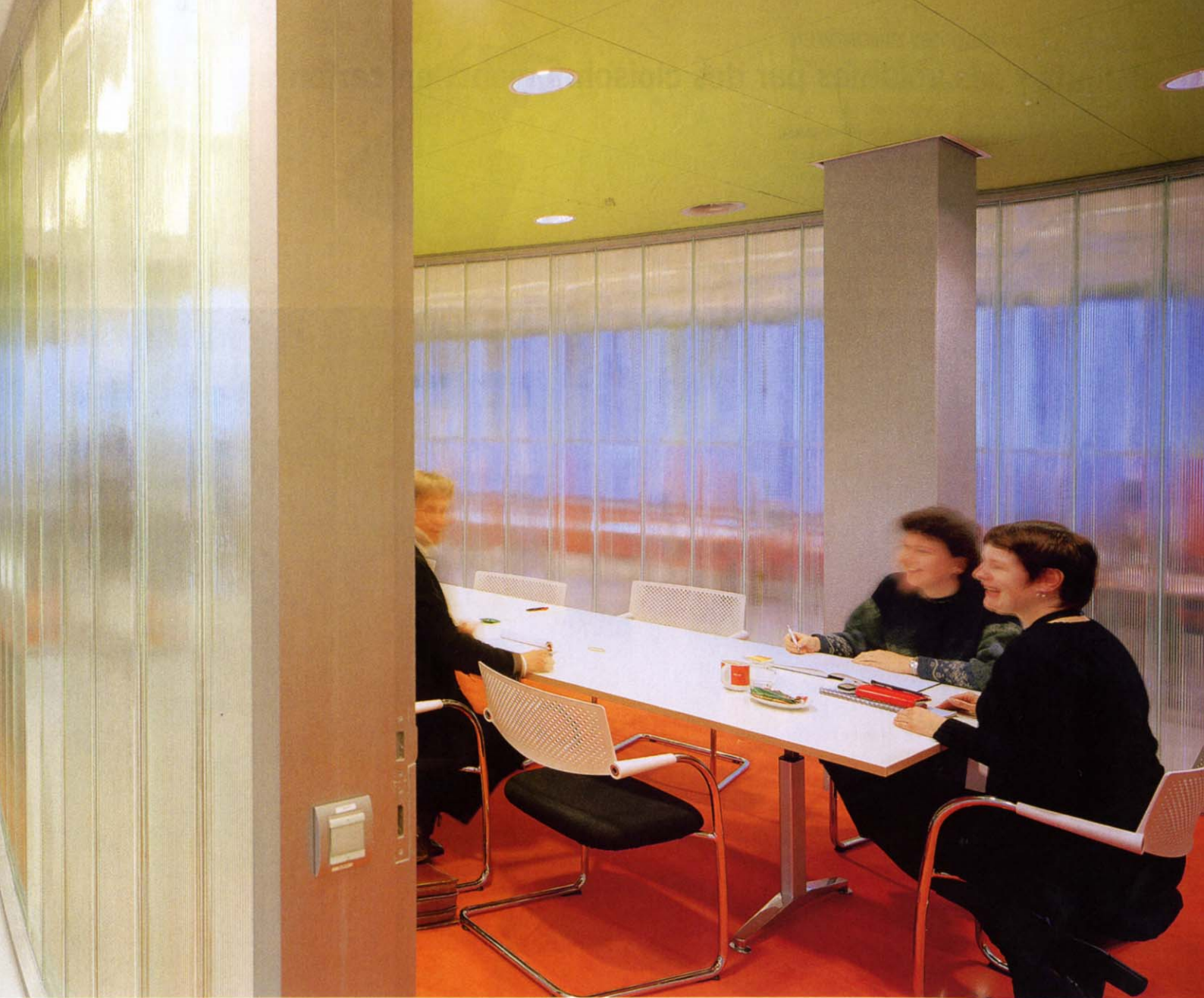
Vue sur les îlots de travail ceinturés de Reglit. Le vide généré entre ces entités est destiné aux flux, aux espaces communs, à la communication.