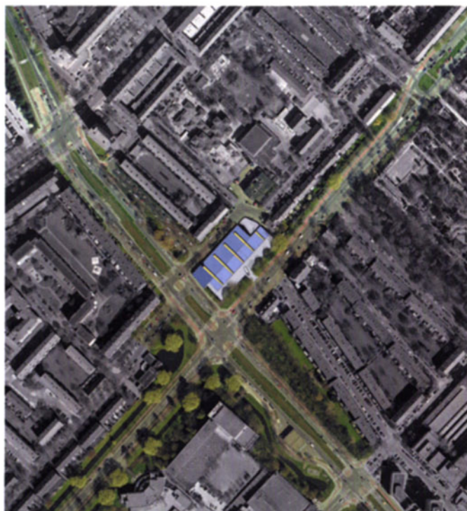
Locatie uit de lucht: bij de kruising Sir Winston Churchillaan-Burgemeester Elsenlaan ligt een 'brandweerhelm'

De slaapverblijven van de brandweerlieden bevinden zich aan de achterkant. Dit biedt twee voordelen: ze liggen aan de rustige kant van de woonwijk en daarbij tevens aan de koele noordzijde. De op de verdieping gesitueerde slaapvertrekken zijn met drie trappen verbonden met de remise om het personeel bij een calamiteit zo snel mogelijk bij de wagens te komen. De achterbouw bevat tevens de technische ruimten als computerfaciliteiten, verwarming en de luchtbehandelingskasten. ■