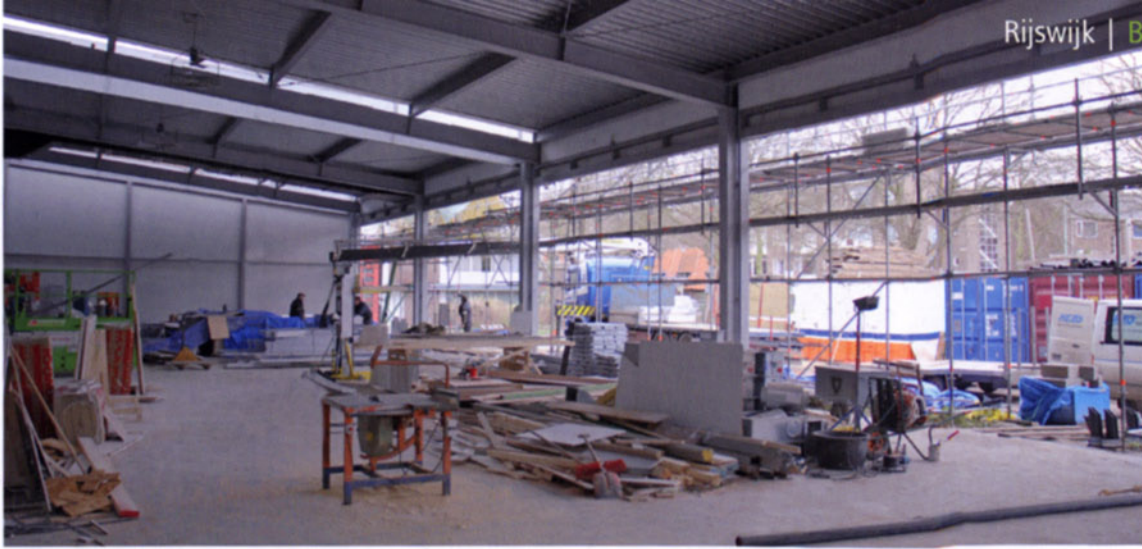
Werkzaamheden in de remise

de SGG VETROFLAM STADIP EW30 en SGG CONTRAFLAM LITE EW60.