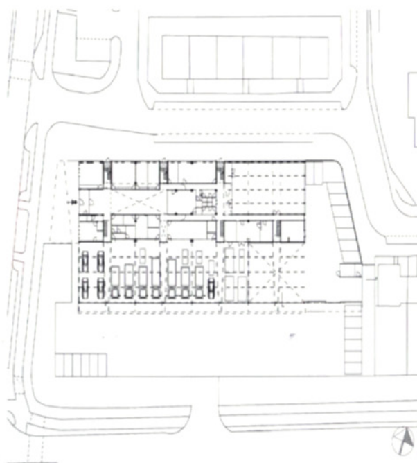
Situatie en begane grond