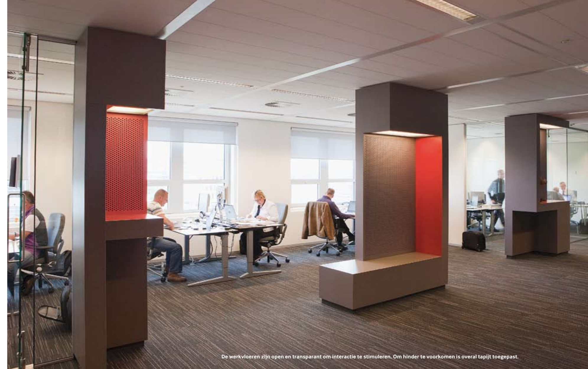
De werkvloeren zijn open en transparant om interactie te stimuleren. Om hinder te voorkomen is overal tapijt toegepast.